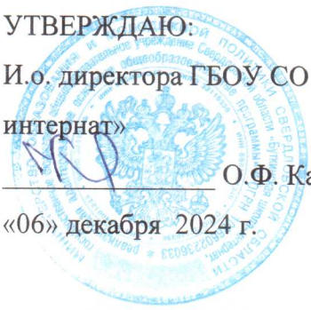
График аттестации педагогических работников ГБОУ СО «Буткинская школа-интернат», аттестующихся в ноябре 2024 года (01.11.24. – 22.11.24.)